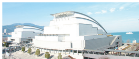
総会会場:びわ湖ホール