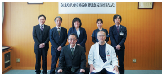
甲西リハビリ病院