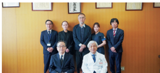
琵琶湖中央リハビリテーション病院

各病院が機能・専門性を活かして役割を分担し、急性期から回復期・慢性期まで切れ目のない医療を届ける——今回の協定締結で、その体制がまた一歩前進しました。引き続き地域連携を強化し、湖南医療圏全体の医療提供体制の充実を目指していきます。