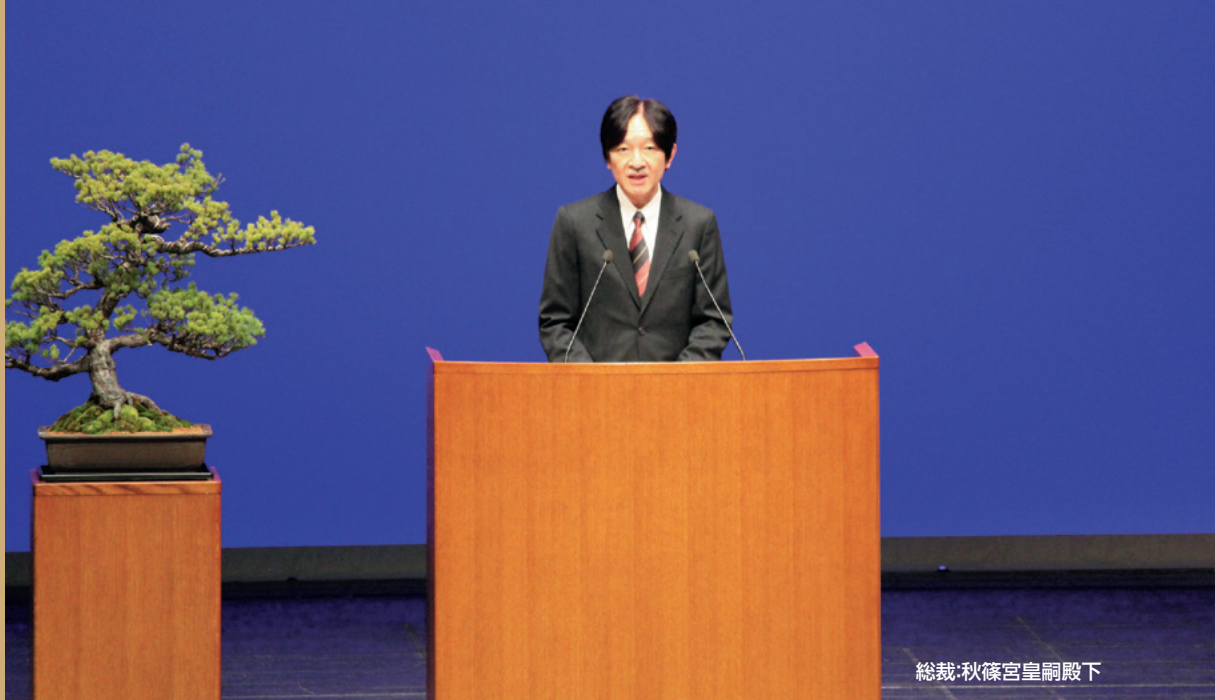
総裁・秋篠宮皇嗣殿下