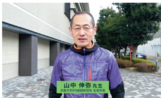
山中伸弥先生 京都大学iPS細胞研究所 名誉所長

特別講演では、2012年にノーベル生理学・医学賞を受賞された京都大学iPS細胞研究所名誉所長である山中伸弥先生による動画講演を通じてiPS細胞研究の最前線に触れる貴重な機会をいただきました。