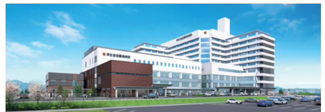
新外来棟完成予想図

現在のがん治療は、普段通りの生活をしながら治療を行える「外来通院治療」が基本です。近日、当院でも新外来棟がオープンし、化学療法の病床数も増床されます。より広々と、リラックスできる環境で、お仕事や日常生活と両立しながら治療を受けていただけます。